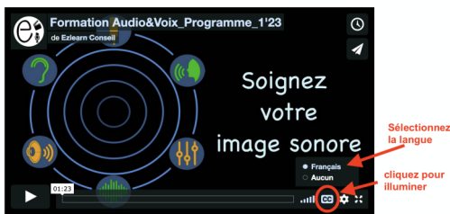
Interface lecteur Vimeo

Pour afficher les sous-titres des vidéos, cliquez sur le bouton « CC » puis choisissez votre langue.